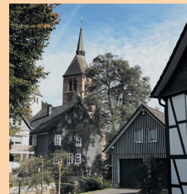
3 Kirchhundem Caritas-Tagespflege Kirchhundem