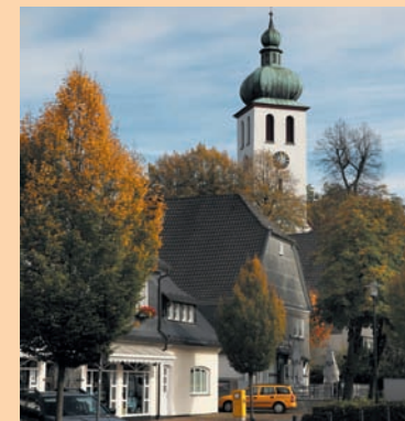
1 Elspe St. Franziskus Seniorenhaus St. Franziskus Tagespflege